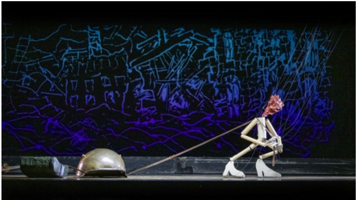
L'Histoire du Soldat © Bernhard Mueller