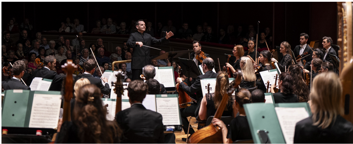
Orchestre Philharmonique Royal de Liège