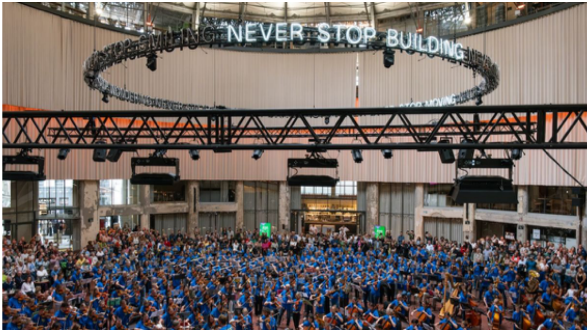
OdeGand

Tot slot laten Choeur de Chambre de Namur en het tienjarige a nocte temporis , in samenwerking met De Bijloke, de barok zegeviëren met de zeldzaam uitgevoerde opera Alcide van Marin Marais en Louis Lully. Alcide (Hercules) biecht zijn buitenechtelijke liefde op voor Iole, die op haar beurt verliefd is op zijn beste vriend. Vocale dramatiek, schitterend georkestreerde passages en elegante dansen... Een kleurrijke, Franse barokavond gegarandeerd.